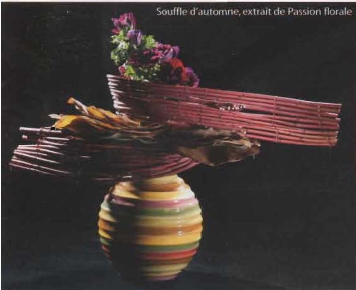
Souffle d'automne, extrait de Passion florale

On peut la retrouver dans une composition florale élaborée par Marie-Françoise Déprez , une artiste véritable, reconnue par les spécialistes Hollandais, "Une femme exigeante qui en épurant les éléments simples utilisés, crée des sculptures florales, en fait des chefs-d'œuvre". Ses deux ouvrages, photographiés superbement par Gérald Gambier , sont édités par La Taillanderie : - Passion florale - Jeux de fleurs